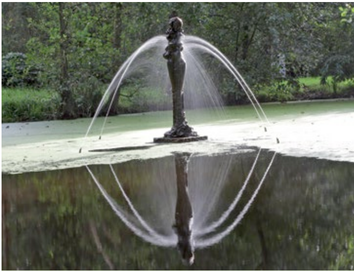
Foto: K. Radetzki: Regentruede, Künstler: Fabian Vogler, Standort Breklum